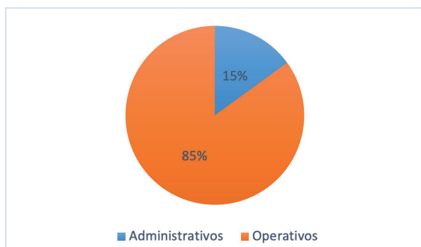
Figura 2. Resultados depresión por personal operativo y administrativo del CBI

Se pudo comprobar la existencia de los diferentes tipos de depresión en la mayoría de las estaciones estos resultados se presentan en mayor porcentaje en un intervalo de edad de 23-33 años ; esto puede ser consecuencia de un negligente cuidado de la salud mental y que está afectando al personal bomberil, además es importante considerar las condiciones de trabajo exigentes que demanda mucho esfuerzo, tanto físico y psicológico, provocando emociones negativas que al no ser canalizadas y liberadas de manera adecuada generarán un embotamiento emocional y esto puede estar ligado a la aparición de alteraciones emocionales.