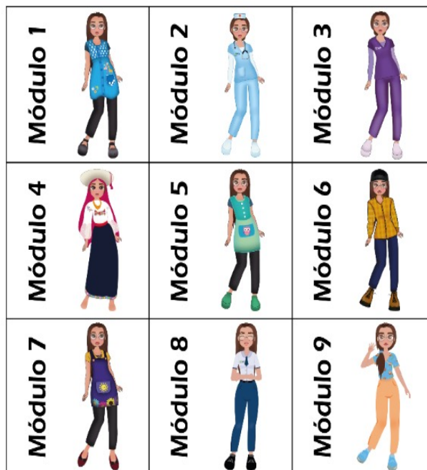
Fig. 1. Diseños representativos de CATI asociados a los proyectos de transferencia.

El personaje representativo de CATI en los módulos 1, 5, 7, 8 y 9 corresponden a estudiantes de la Escuela de Educación; en los módulos 2 y 3 a estudiantes de la Escuela de Salud y Bienestar, y en los módulos 4 y 6 a estudiantes de la Escuela de Educación Comercial, Producción, Servicios y Seguridad.